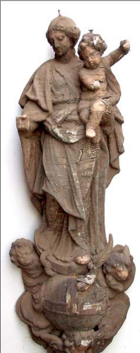
De Madonna met Kind, 'Onze-Lieve-Vrouw Medeverlosseres' van de Wiegstraat 3, Antwerpen, werd in januari 2006 door restaurateur Jeroen Boel afgenomen en naar het atelier overgebracht.