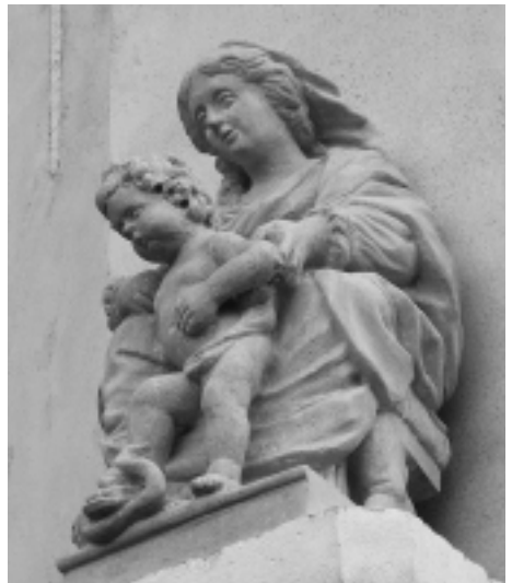
Het in 2003 herkapte beeld.

In de Antwerpse monumentale kerken kan je Quellin nog wel ontmoeten. In de Sint-Andrieskerk bevindt zich een van zijn topwerken, het witmarmeren Sint-Pietersbeeld uit 1658. - Wim Strecker