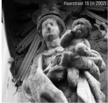
Haarstraat 16 (in 2002)

en Parochiaanstraat . Na afwerking hiervan volgen twee Madonna's , deze van de Haarstraat 16 en die van de hoek Kloosterstraat 155 en Willem Lepelstraat ('Heilig Huisken'). Alle beelden zullen aan de gevel zelf worden behandeld. Mogen de 'weergoden' ons welgezind blijven.