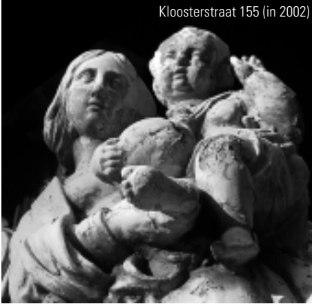
Kloosterstraat 155 (in 2002)