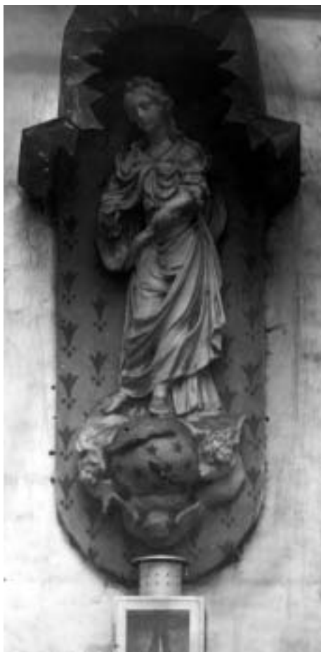
In de Kuipersstraat, 1934 (Foto: Stadsarchief Antwerpen, SA035071)

Bij een bominslag in 1944, werd grote schade veroorzaakt in de onmiddellijke nabijheid van de Kuipersstraat. Dat vormde voor deze buurt, de onmiddellijke aanleiding tot het opmaken van een Bijzonder Plan van Aanleg. In 1947 werd opdracht gegeven om 447 woningen te saneren. Uiteindelijk werd op 4 maart 1957 het desbetreffende pand aan de Kuipersstraat, gesloopt en het beeld werd overgebracht naar het Volkskundemuseum (Antwerpen). Heden ten dage zijn er op deze plek (Vleeshuiswijk) sociale woningen en collectieve tuinen terug te vinden, het oude stratentracé bleef grotendeels bewaard.