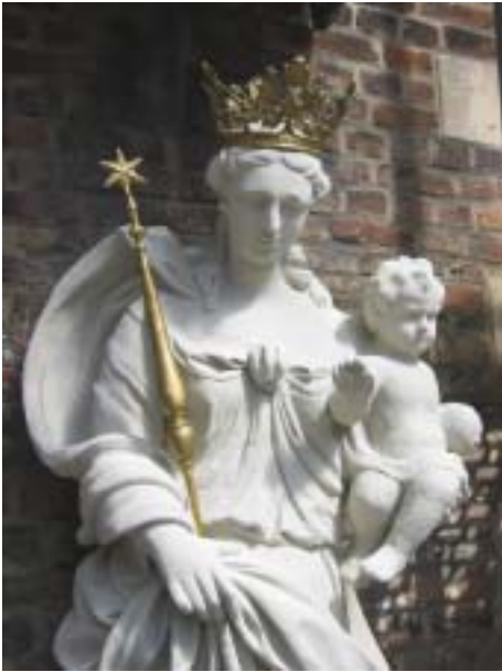
De in 2003 gerestaureerde Madonna van de 'Madonnakoer' in de Prinsstraat 13.

werden van hun koperoxidatie ontdaan. De nog aanwezige verguldsels werden gefixeerd en de lacunes getoucheerd. De koperen luifel was nog in zeer goede staat. Er werd besloten het groene patina te bewaren omdat die een beschermlaag voor het koper vormt.