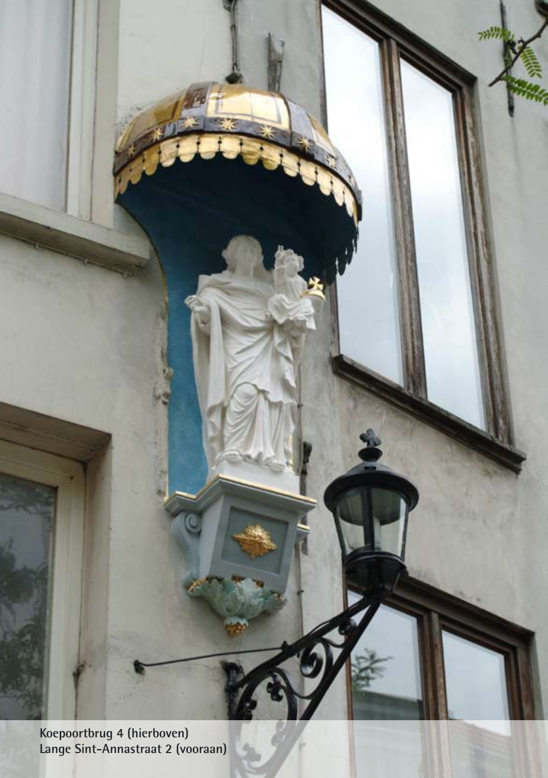
Koepoortbrug 4 (hierboven) Lange Sint-Annastraat 2 (vooraan)