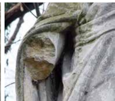
Onze-Lieve-Vrouw Onbevleed Ontvangen, Italiëlei (tuin kapucijnen) – voor en na behandeling (zie p. 10)