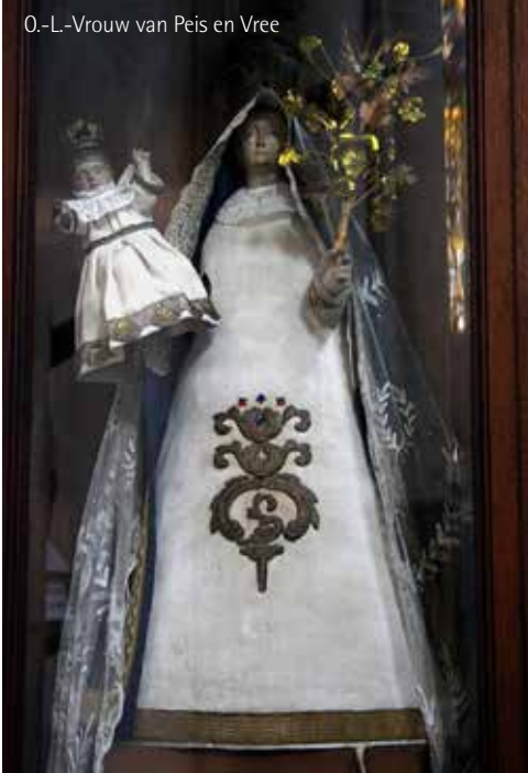
O.-L.-Vrouw van Peis en Vree