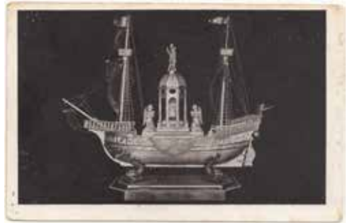
Antwerpen. Schipken "Amalfi" met wonderbare olie van den H. Andreas. Kerk van St Andries Antwerpen Prentbriefkaart, ongedateerd (na 1905, voor 1945), zonder naam van uitgever - Verz. WS