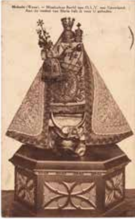
"Melsele (Waes). Mirakuleus beeld van O.L.V. van Gaverland. Aan de voeten van Maria heb ik voor U gebeden" Prentbriefkaart, ongedateerd (jaren 1940-1950)

En ook dit beeldje, al is het dan zo klein, werd elk jaar meedragen in de processie van Sint-Andries.