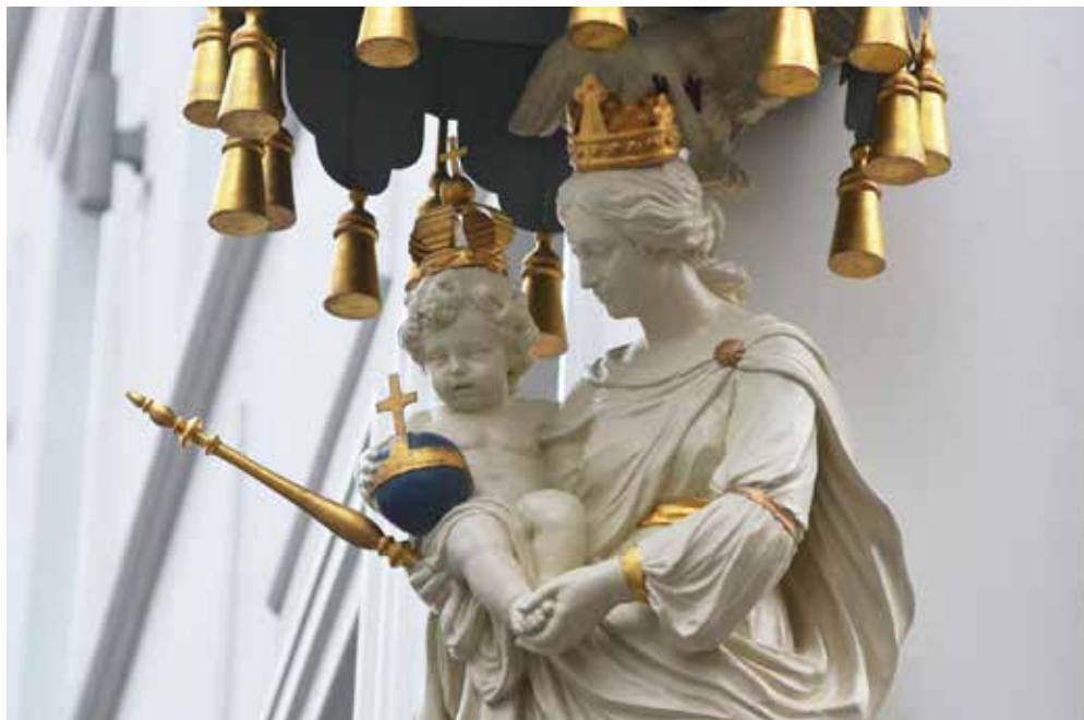
Boven: Madonna Leeuwenstraat, Reyndersstraat 26-28. Onder: Madonna Bogaardestraat, Schoytestraat 40, met bijgewerkte console