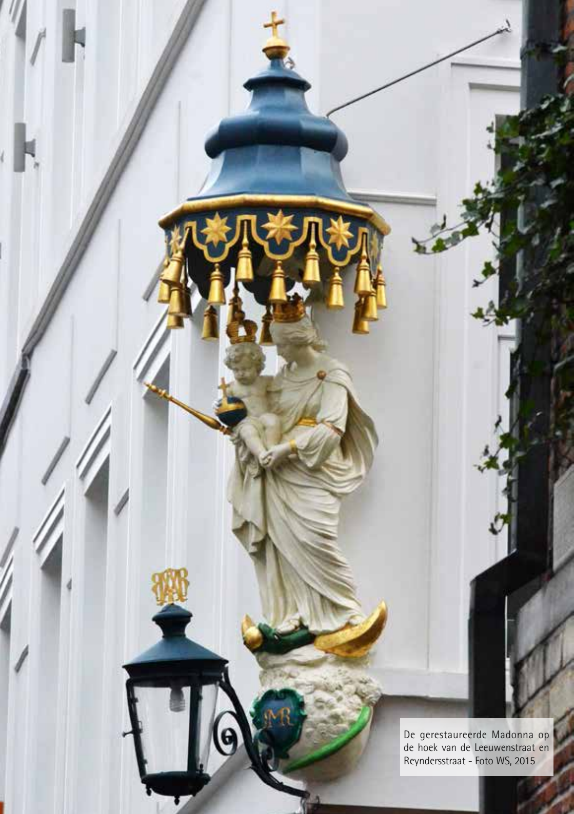
De gerestaureerde Madonna op de hoek van de Leeuwenstraat en Reyndersstraat - Foto WS, 2015