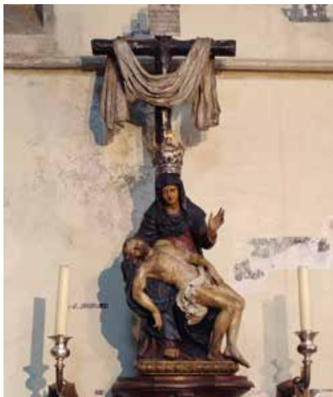
Foto hiernaast, de processiemadonna 'Hulp der Christenen' op haar altaar, foto WS 1 april 2016

dit schilderij, een altaarstuk dat al omstreeks 1700 verdween. Als vervanging voor dit schilderij plaatste men het beeld van de 'Bedrukte Moeder Gods' (de neergezeten Maria draagt de dode Christus op haar schoot = piëta). Hiervoor werd een architecturaal uitgewerkte ondiepe nis gecreëerd en een sokkel geflankeerd door twee engelen in aanbidding. Omdat de piëta in deze onbedoelde context te klein overkwam, voegde men een monumentale stralenkrans met zinnebeeldige duif achter de voorstelling toe. Deze voorstelling werd later dan weer vervangen door een groot kruis, behangen met lijkdoek. Deze piëta, een gepolychromeerde houten sculptuur, toegeschreven aan Artus Quellin de Jonge, werd in 1650 verworven en reeds datzelfde jaar door bisschop Gaspar Nemius 'verheven' (gewijd).