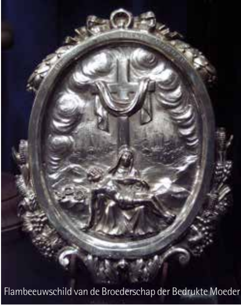
Flambeeuwscild van de Broederschap der Bedrukte Moeder

De devotie tot de 'Bedrukte Moeder Gods' werd in de volgende jaren geïllustreerd door het schenken van gewaden, gunsten en zelfs door een wonderbare genezing.