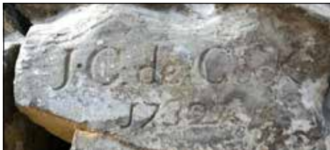
"J.C. de Cock 1732" op de voetplaat van de Moeder van Smarten en "W. Pompe fecit" op het lendendoek van het Christuscorpus

Vermeldenswaard zijn twee bij de restauratie vrijgelegde signaturen: "J.C. de Cock 1732" op de voetplaat van het Mariabeeld en "W. Pompe fecit" op het lendendoek van het Christuscorpus. Bij het beeld van Johannes kon niets worden waargenomen.