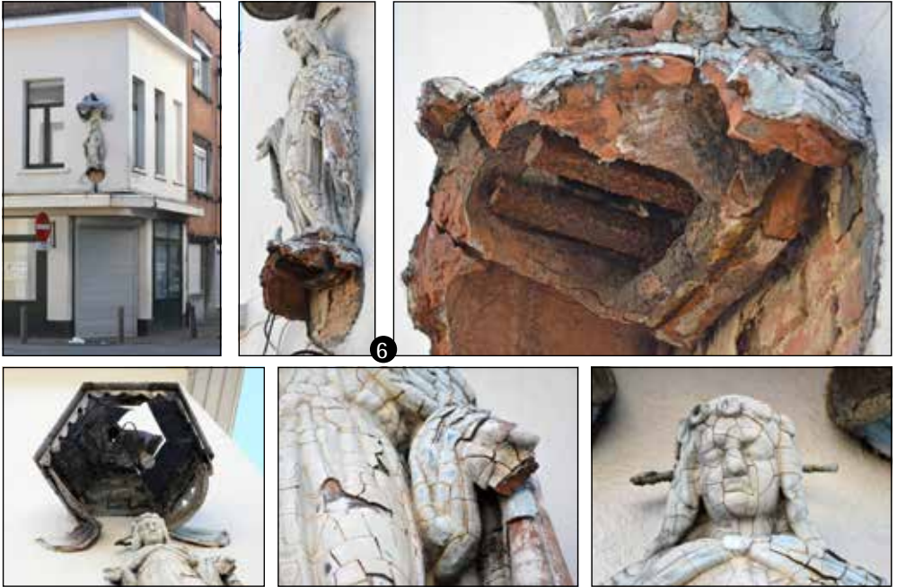
O.-L.-V. Onbevlekt Ontvangen - Duinstraat, Lange Zavelstraat 93 - Foto's WS, 9 augustus 2017