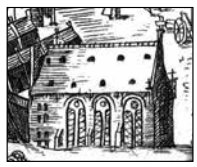
Hogenberg, 1568 - 1590 (det.)