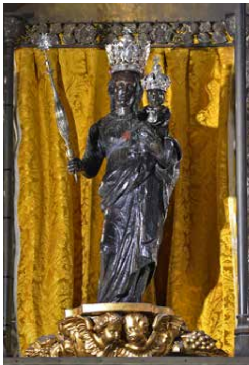
'Onze-Lieve-Vrouw van het Kasteel' op haar altaar in Sint-Joriskerk. In 1926 werden de kapelwanden gepolychromeerd met een repetitief Mariamonogram. (Foto WS, 2018 boven en 2013 onder)

Wees ervan overtuigd: de parochianen van Sint-Joris zijn fier op hun processiemadonna. Je kan O.-L.-Vrouw van het Kasteel altijd gaan bewonderen in (en tevens genieten van) de prachtige kerk aan het Mechelseplein. Doen!