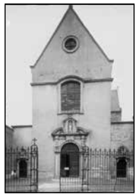
onbelerend fotograaf, opname 1976 e Bildarchiv Foto Marburg