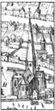
Hofnagel 1598, SAA.12 # 5830 (det.)