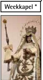
* actueel in onbruik

Onze-Lieve-Vrouw 'Conception' O.-L.-V. Onbevlekt Ontvangen O.-L.-V. zonder Kind; a° 1514 Oprichting broederschap; Beeld oude Sint-Joriskerk; later processiebeeld Sint-Augustinuskerk; Volplastische houtsculptuur (voeten verdwenen), 66 cm hoog (zonder wereldbol).