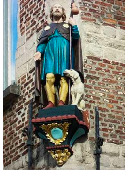
H. Rochus op de hoek van de Hoornstraat en de Lansstraat voor restauratie (links) en na restauratie (rechts)