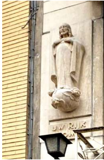
Christus Heilig Hart in de Lombardenvest 12 voor reiniging (links), na reiniging (rechts) en tijdens de reiniging (vorige bladzijde onderaan)