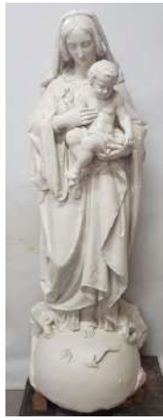
O.L.V. met Kind in de Vingerlingstraat 14 in 1976 (links), aan het begin van de restauratie in 2023 (midden) en na de restauratie (rechts).