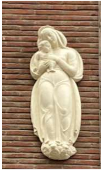
Onze-Lieve-Vrouw met Kind in de Drukkerijstraat 6 voor reiniging (links), na reiniging (rechts) en tijdens de reiniging (vorige bladzijde onderaan)