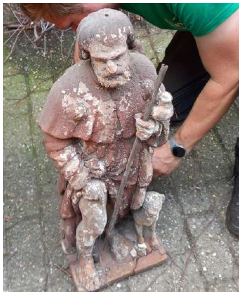
H. Rochus op de hoek van de Kloosterstraat en de Willem Lepelstraat, overgroeid door klimop (bovenaan) en tijdens de afname (foto's onderaan)